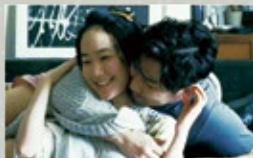
漫長的藉口 The Long Excuse