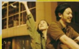
愛情,突如其來 Over the Fence