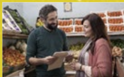
哈拉夜未眠 Halal Love