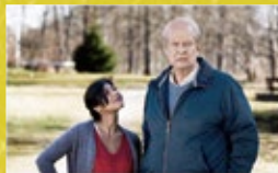
明天別再來敲門 A Man Called Ove