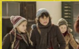
牧羊小英雄 Little Mountain Boy